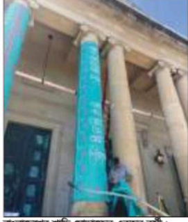
বাংলাদেশের শাড়ি মোড়ালেছেন একজন কর্মী।